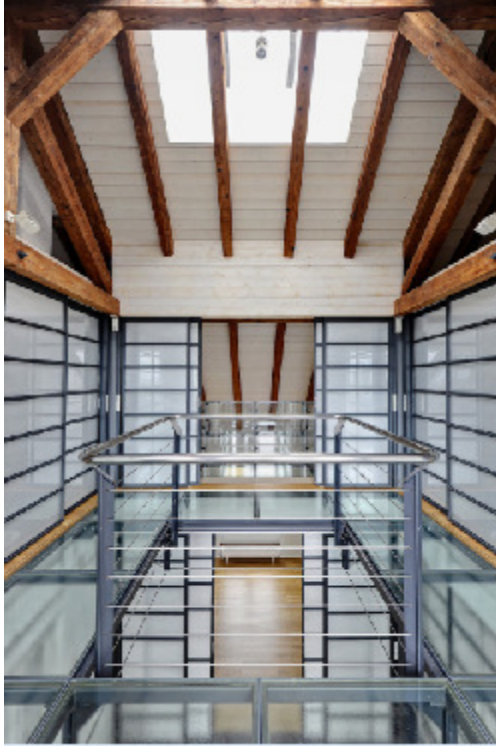
Rütschistr. 21, 8037 Zürich

S^* = [S_0, [S_1, [S_2, [ \dots ]]]] mit S^* \supset S_0 \supset \dots \supset S_{n-1} .