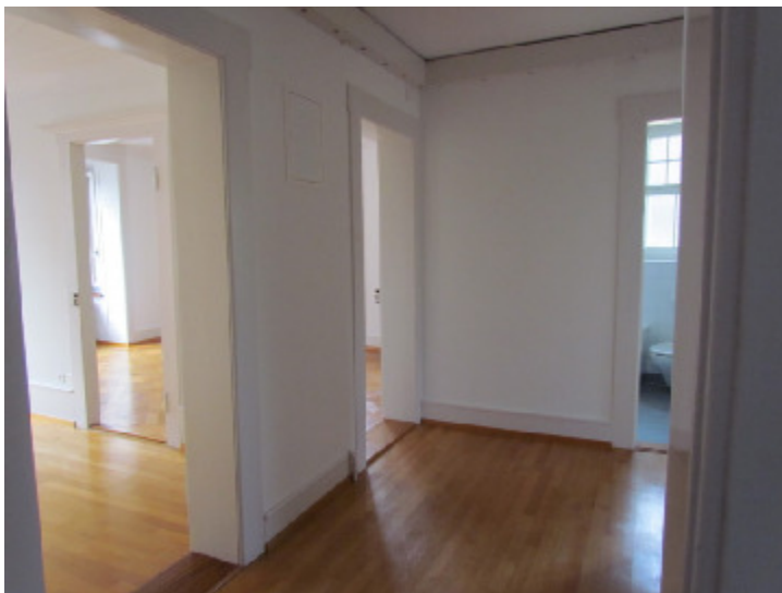
Neptunstr. 97, 8032 Zürich

S^* = [S_0, S_1, S_2, \dots] mit S^* = S_0 \cup \dots \cup S_{n-1} .